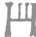
225 Ms. nella.