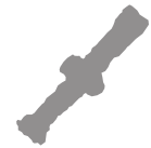
15 Gabinetto, latrina.

Item posede una stalla e tabiato, con un pezo di chiesura et orto contiguo a detta